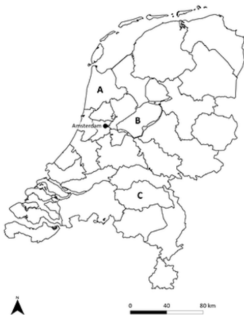
De 25 Nederlandse politiekorpsen zoals ze bestonden ten tijde van het onderzoek (2002-2009) NSCR

We willen weten of daders die delicten plegen in meerdere politieregio's een kleinere kans hebben om gearresteerd te worden dan daders die hun delicten in één enkele politieregio plegen. Daarnaast willen we ook weten of de afstand tussen de politieregio's waarin een dader zijn delicten heeft gepleegd een invloed heeft op de pakkans. Het zou kunnen zijn dat aangrenzende regio's meer met elkaar samen werken dan de regio's die verder uit elkaar liggen.